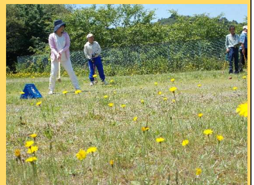
本吉グラウンドゴルフ大会

性があります。面白い人もたくさんいます。「風変わり」ではなく、本吉地域の味となります。個性のないまちに興味を抱く人がいるでしょうか。この地域をいろいろな形でアピールし、住みやすい地域にしたいと思います。