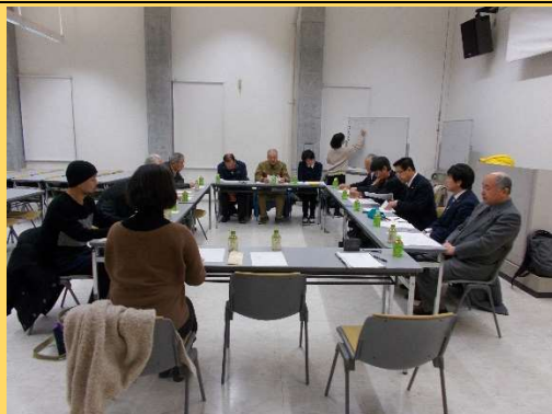
はまなす議員会との懇談会

初めての懇談会でしたが、懇談テーマに基づいて活発な話し合いがなされ、貴重な意見交換の機会となりました。 当委員会では、今後も懇談の機会を設けて、はまなす議員会との交流を行い、今後の活動につなげていきたいと考えております。はまなす議員会の皆さんありがとうございました。