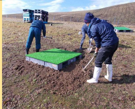
コースのスタート台設置作業

を撫で下ろす思いでした。 パークゴルフ場を通じて「モーランド・本吉のお客さんを増やしたい」との皆様の想いに感謝し、今後のコース管理に努めて参ります。